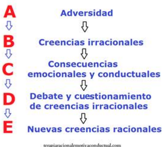
Figura 2. Método ABCDE.

«No son los acontecimientos (A) los que nos generan los estados emocionales y conductas (C), sino la manera de interpretarlos (B). Por lo tanto, si somos capaces de generar nuevos esquemas mentales (D), cuestionando nuestros patrones de pensamiento, seremos capaces de generar estados emociones menos dolorosos, más positivos y acordes con la realidad (E)» (Ellis et al., 2009).